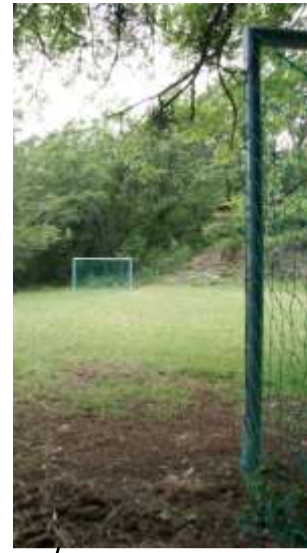
Buts hand-foot aire de Ste Madeleine 2010