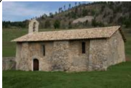
Remplacement toiture église de Mélan en 2010