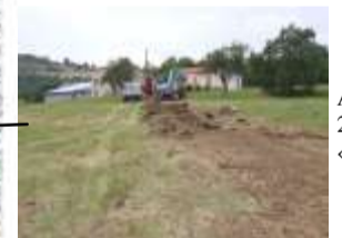
Adduction d'eau 2009 au hameau « La Faysse »