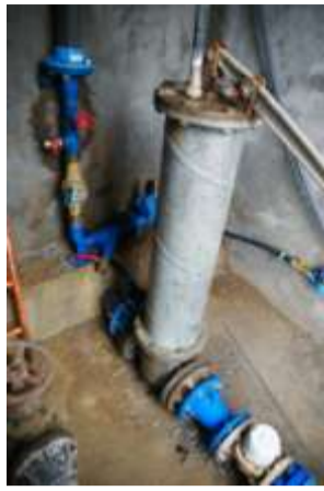
Mise en place comptage entrée-sortie des 3 réservoirs 2010