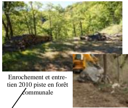
Enrochement et entretien 2010 piste en forêt communale