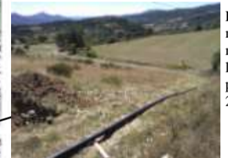
Remplacement de 400 ml de canalisation principale 2010