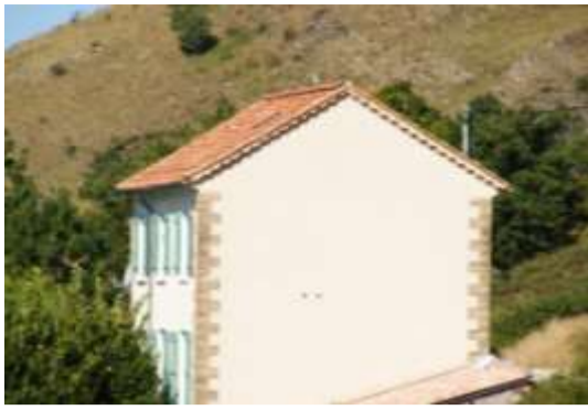
Le bâtiment communal de Mélan en 2010, loué depuis mai 2008