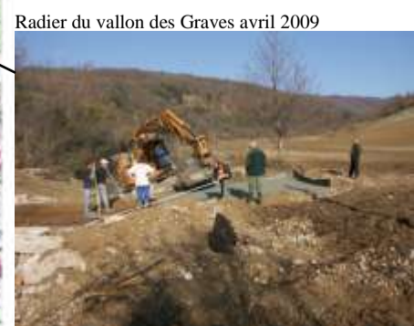
Radier du vallon des Graves avril 2009