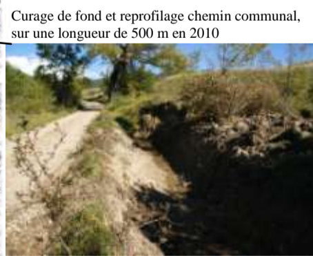
Curage de fond et reprofilage chemin communal, sur une longueur de 500 m en 2010